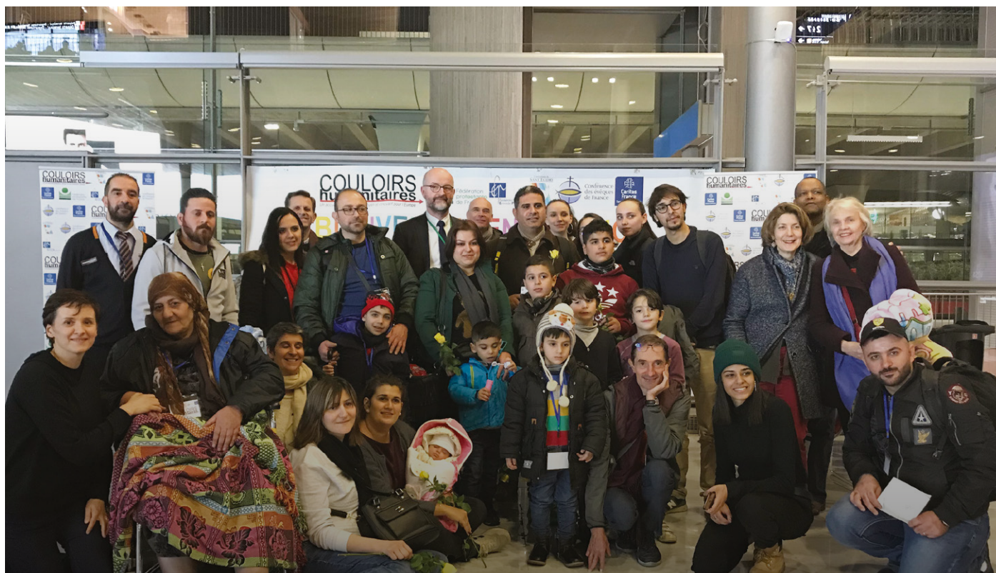
Arrivée, juin 2019.